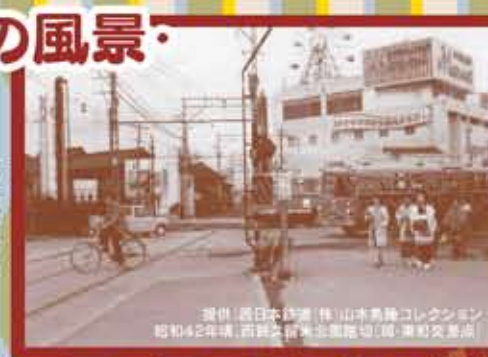
昭和42年頃、西鉄久留米駅南口(旧・東町交差点)